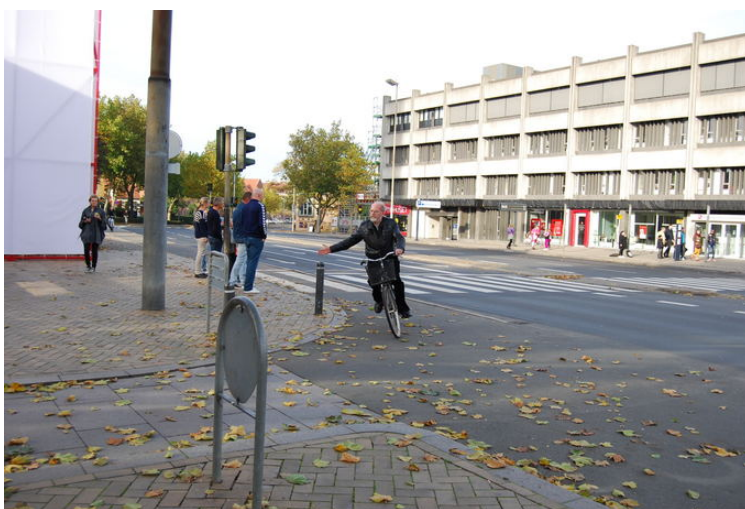
Važinėjant dviračiu Danijoje itin svarbu rodyti signalus ir paisyti kitų kelių eismo taisyklių. Vaikai su jomis supažindinami jau pirmose klasėse.

Kuo tokios pasiturinčios šalies kaip Danija šeimos panašios į tas, kurios gyvena tolimojoje Azijoje? Atsakymas: dažnai dviratis danams tarnauja kaip puikus šeimyninis automobilis, ant kurio gali „sukrauti“ kone visus šeimos narius. Vyresnio amžiaus poros kartais mina vieną dviratį dvejomis sėdynėmis, o tos, kurios turi mažamečius vaikus, prisikabina specialias priekabas – vėžimėlius. Tad mitą, kad šeimai reikia erdvaus ir patogaus automobilio, danai išsklaido it dūmą.