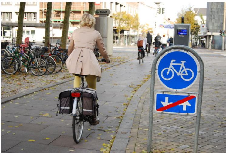
Lygių teisių principas tarp vyrų ir moterų Danijoje galioja ir tuomet kai tenka taisyti dviračius. Tad moterims ir merginoms tą pravartu mokėti pačioms.

Jeigu paklaustumėte manęs, kaip vienu žodžiu galėčiau apibūdinti Daniją, nė nesuabejojus tarčiau: dviratis. Regis, ši transporto priemonė įkūnija viską, kas taip svarbu šios šalies gyventojams: lygybę, sveiką gyvenimo būdą, minimalizmą, paprastumą ir didelį dėmesį ekologijai.