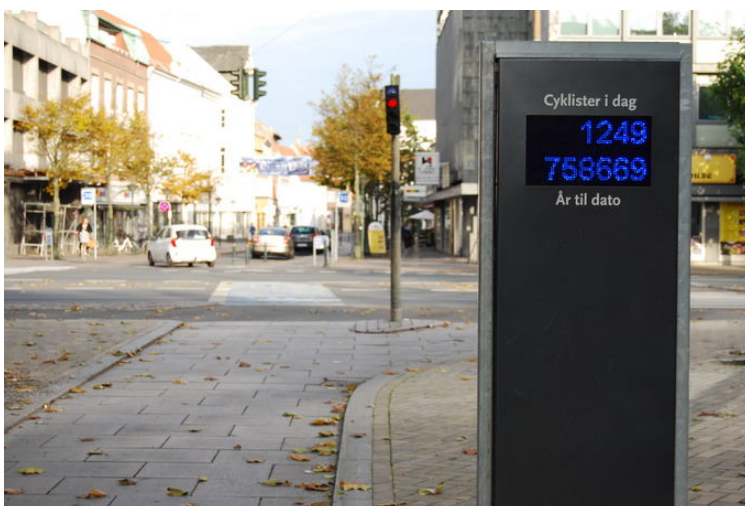
Dviračius Danijoje siekiama populiarinti ir vadinamaisiais dviračių barometrais. Vienas iš Odensės miesto centre įrengtų barometrų skaičiuoja, kiek dviračių pravažiuoja pro šalį per dieną ir per metus.

Lietuvoje dažnai žvilgtelime pro langą ir pagal praeivius nusprendžiame, kaip tinkamai apsirengti. Apie tokį būdą išmatuoti temperatūrą Danijoje verčiau pamiršti. Čia ir vasario mėnesį tikėtina išvysti ką nors dviratį minant vien trumparankoviais marškinėliais. Nors, kaip žinia, Skandinavijoje žiemos kur kas švelnesnės nei Lietuvoje, šaltukas tamsiuoju metų laiku čia irgi paspaudžia. O kurgi dar gūsinis vėjas, kuris lyg tyčia visada pučia į veidą.