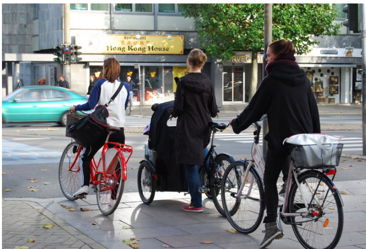
Sportbačiai – bene populiariausias apavas Danijoje. Juos dėvi kone visi: nuo moksleivių ir studentų iki universiteto profesorių ir verslininkų.

Vos atvykus į Daniją, netrunki pastebėti: bene populiariausias apavas čia – sportbačiai. Nieko keisto, kadangi toks pasirinkimas minant dviratį yra itin patogus. Tačiau kiek keisčiau, kuomet penktadienio vakarą puošniomis suknelėmis pasidabinusios merginos taip pat mūvi sportiniais bateliais. Sportbačiai čia puikiai dera prie visko – net ir prie verslo kostiumo.